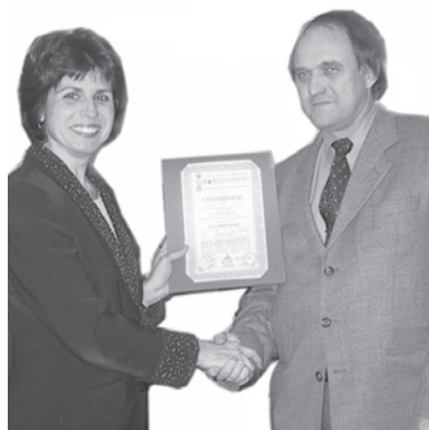
Получаването на сертификат за завършено обучение е незабравим миг за всеки