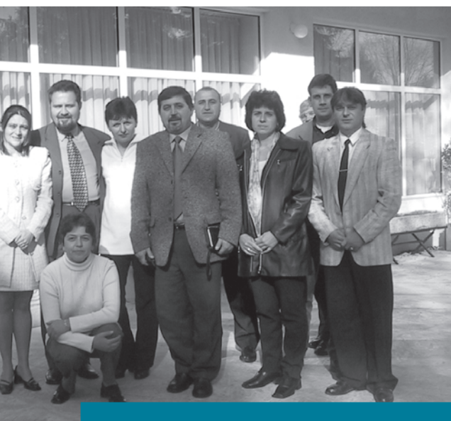
Участници и организатори