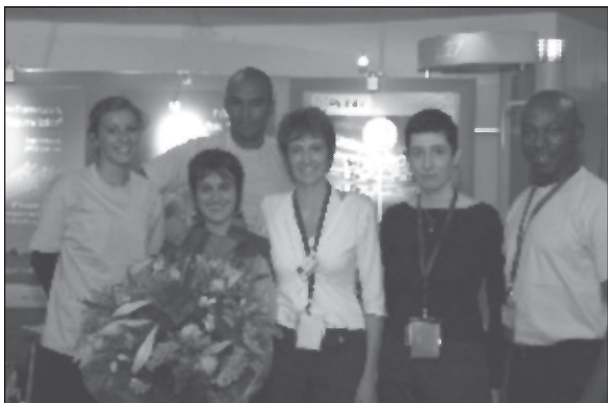
Конференция „Bridging the Broadband Gap - Ползите от оптичните връзки за селски или по-малко развити региони“ (Брюксел, 14 -15 май 2007 г.)

Специалните аудио-видео терминали, оборудвани в допълнение с принтер, камера и други външни устройства за обработка и изпращане