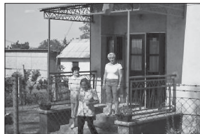
Детски ясли в Gesztely-Ujharangod, Унгария

Подходът, който използва проектът, насърчава участието на общностите, основава се на дълбоко познаване нуждите на целевите групи от малките населени места и на създаването на лични контакти. Инициативата е подкрепена законодателно, което поставя предоставяните социални услуги на нивото на човешките права. На практика социалните помощници реализират политика за осигуряване на интегрирани услуги : здравеопазване, жилищни грижи, социални услуги, заетост и икономическо развитие, при това съобразени с особеностите на всяко населено място. Подобен подход създава социален капитал и вдъхва живот в местните общности. Разбира се, проблеми съществуват: предоставянето на услугите твърде много зависи от личните качества на социалните помощници, от местните политици, те трудно се поддават на мониторинг и контрол. Нещо повече, понякога пълната липса на здравни и социални грижи в отдалечени места може да доведе до голямо натоварване на изпълняващия длъжността помощник.