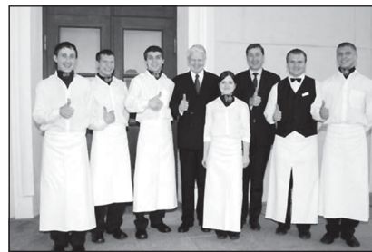
Облечени за сервиране - участниците в проекта с Президента на Република Исландия Олаф Ранар и Кмета на Вилнюс Артурас Зуокас

Проектът „Преодолей пристрастеността“ спечели подкрепа от инициативата на Европейския социален фонд EQUAL и е в действие от 2004 до 2007. Той се управлява със съвместното участие на: неправителствената организация „Проекти за социална подкрепа“ (Socialiniai paramos projektai), Градския съвет на Вилнюс, Центъра за проблеми с пристрастяването, както и Кооперативния колеж във Вилнюс. В голяма степен той дължи успеха си на ангажимента, поет от Градския съвет за осигуряване на необходимите помещения в центъра