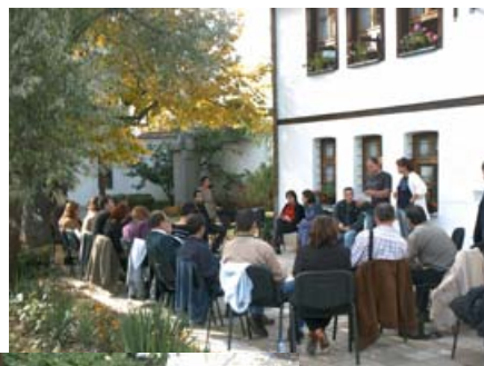
Работни срещи в екорегиион Централен Балкан - юг

За да се осигури успешна реализация и институционализиране на целите и действията, залегнали в Регионалните планове за действие за екотуризъм, следва те да бъдат интегрирани в Общинските планове за развитие там, където екотуризмът е с действителен потенциал. По този начин се създават реални предпоставки за прилагане на единна политика по отношение на екотуризма както на местно, така и на