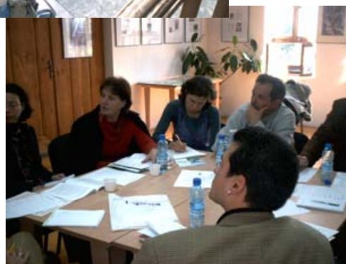
Сдружение за екотуризъм „Централен Балкан - Калофер“

регионално ниво, като същевременно се отчита интересът на местната общност и се гарантира нейната съпричастност. В дългосрочен план това ще допринесе не само за стратегическото планиране на местно ниво, но и ще даде реална база за реализация на разработените мерки чрез осъществяване на конкретни проекти в рамките на предприемаческа програма ФАР на ЕС „Развитие на българския екотуризъм“, която се очаква да стартира в началото на 2004 г.