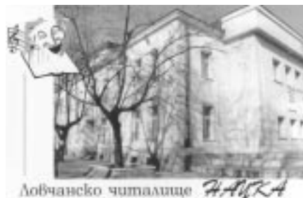
Ловчанско читалище НАУКА

В края на 1998 г. община Ловеч, в лицето на главния си секретар, предоставя на читалище „Наука“ информация за Програмата на ООН за развитие и в началото на 1999 г. читалището кандидатства към програмата с проект „Стимулиране