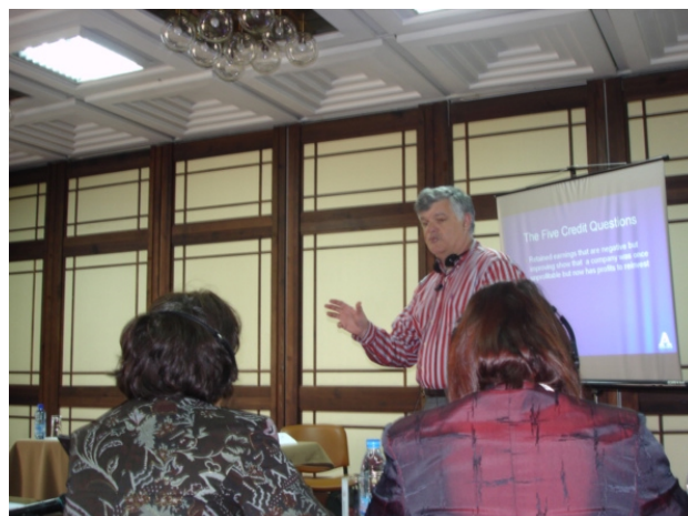
Обучение на общински експерти по местно икономическо развитие

През ноември 2006 г. се проведе първата Годишна конференция „Общините и бизнесът - партньори за икономическо развитие“ , в която взеха участие 180 представители на правителството, местните власти, бизнеса, НПО и образователните институции. Темите, които се обсъдиха на конференцията, бяха свързани с участието на бизнеса във формиране на общинските политики за подобряване на бизнес климата и привличане на инвестиции; насоките на ЕС за създаване на успешни обществено-частни партньорства; аспектите на между-общинското коопериране; развитието на инфраструктура в подкрепа на инвестициите; работната сила като фактор за успех и др. В конференцията участваха водещи специалисти от САЩ, Великобритания и Унгария.