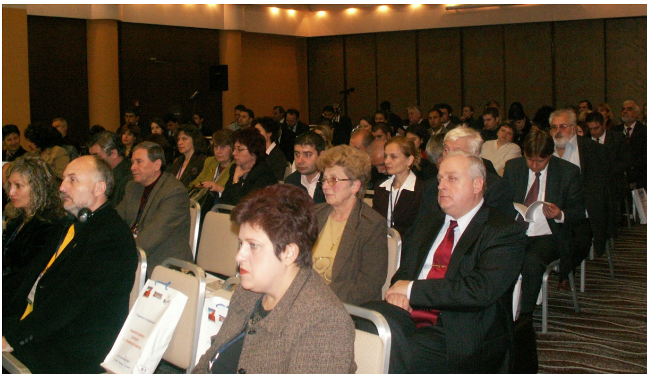
Годишна конференция "Общините и бизнесът - партньори за икономическо развитие", 29 и 30 ноември 2006 г., х-л "Хилтън", София

ФРМС има добрата амбиция ежегодно да провежда Годишна конференция „Общините и бизнесът - партньори за икономическо развитие“, да я утвърди като ефективна форма на диалог и като генератор за успешно сътрудничество между бизнеса и местните власти.